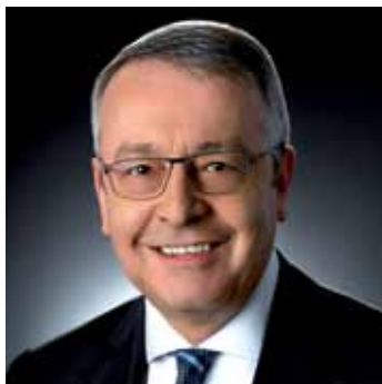
Antoine Frérot, předseda představenstva a generální ředitel společnosti Veolia

TENTO DOKUMENT JE VODÍTKEM PRO KAŽDODENNÍ CHOVÁNÍ VŠECH ZAMĚSTNANCŮ SKUPINY VEOLIA.